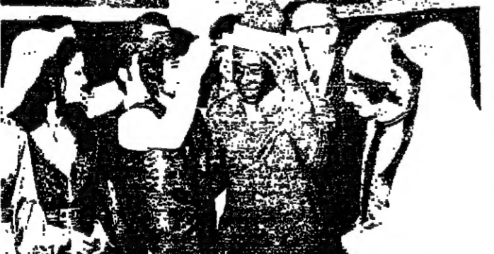
ملك الكرة يعتمر « اللبادة » في حفلة « البورفاج » مساء امس

اقام مهرجان خطابي على مدرج جامعة دمشق مساء امس... مهرجان بدمشق في تكري تأسيسي حزب البعث